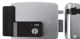
ACG8660 ACG8670 ACG8650